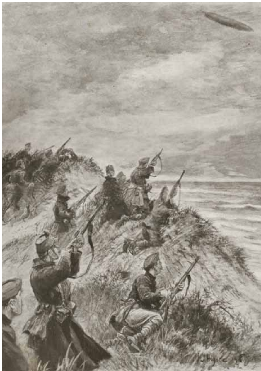
Nederlandse soldaten vuren op een Duitse Zeppelin.

Het waren niet alleen Belgen, Britten en Duitsers die aandacht kregen, ook het lot van Italiaanse krijgsgevangenen mocht zich in een warme belangstelling koesteren. Voor hen werden op maandag 20 en zondag 26 november 1916 wat we nu noemen benefietvoorstellingen georganiseerd in het Haagse Pulchri Studio . Op de omslag van het programmaboekje staat een officier van de Bersaglieri , het befaamde Italiaanse keurkorps, getekend door Hoyncck. Het was druk in Den Haag