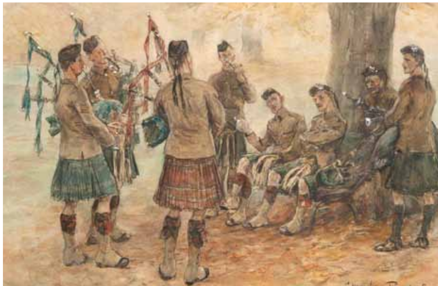
De Schotten in Clingendael 1918.

Op maandag 24 december 1917 vond er in Amsterdam weer een benefietvoorstelling plaats, deze keer voor krijgsgevangenen Serven. Hoynck tekende de omslag van het programmaboekje. [Afbeelding 15] Een maand later, op 21 januari 1918, vond er een tweede benefietvoorstelling