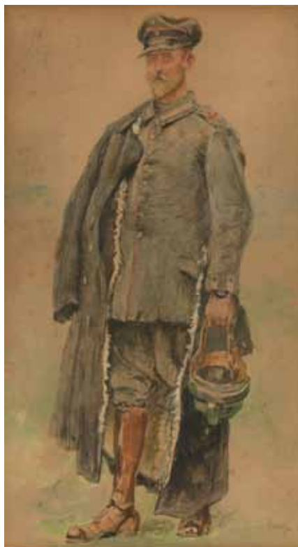
Geïnterneerde Duitse vlieger met bontjas en polskompas.