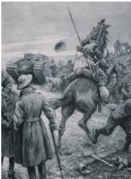
Een symbolische tekening van de transformatie van de cavalerie: een tank en een paard op het slagveld.

wij veel aquarellen van met name Schotse militairen, voor wie hij een zwak had. Zijn reguliere bezoeken aan interneringskampen weerhielden hem niet om tekeningen in te sturen naar The Graphic dat op 5 mei 1917 een bijna symbolische tekening publiceerde van de transformatie van de cavalerie: een tank en een paard op het slagveld. Hoynck had het feit dat paarden gewend waren aan het fluiten van kogels en het ontploffen van granaten, maar schichtig werden van een aanrollende tank, uit eerste hand vernomen van een officier van een Nederlandse missie aan het Somme-front.